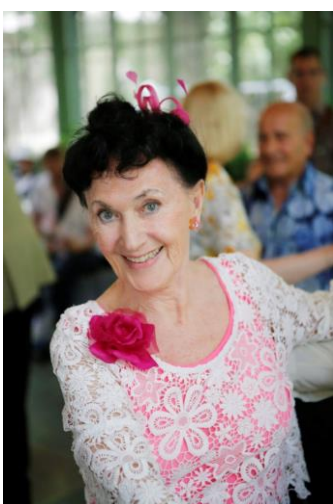
Genève, ville sociale et solidaire www.ville-geneve.ch