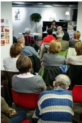
Genève, ville sociale et solidaire www.ville-geneve.ch